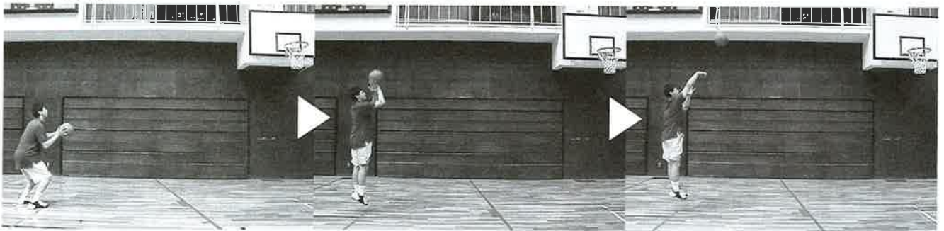
“トリプル・スレット・ポジション” から、ワン・モーション (一動作) ですぐにジャンプ・シュートできる