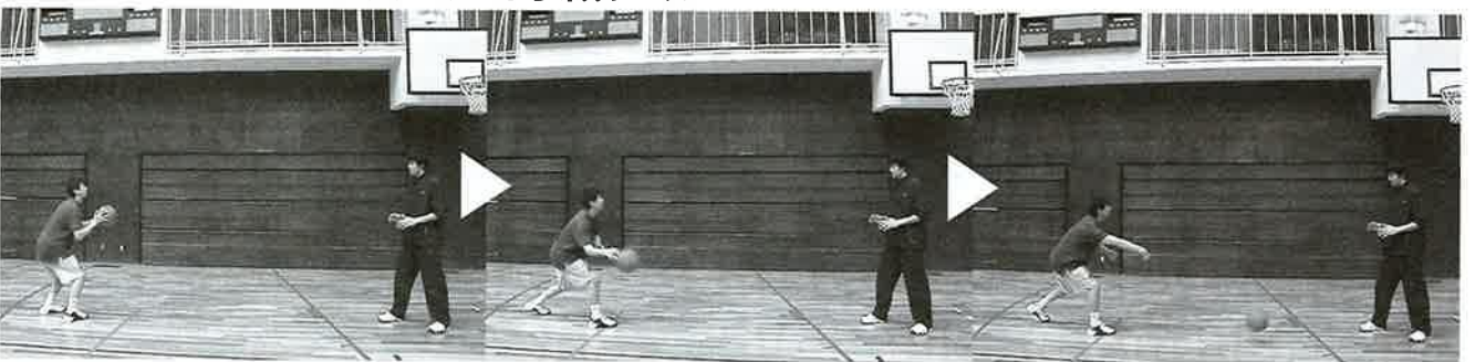
同じ姿勢から、ワン・モーション (一動作) で味方にパスを出すこともできる