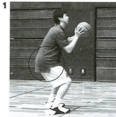
1 お尻で受けるように沈み込む、基本的なヒップ・ディッピングの姿勢

『マッスル&フィットネス日本版』にて連載中の「インナー・マッスルを使った動きづくり革命」が単行本になりました (送料込1,000円)。詳しくはホームページをご参照ください。