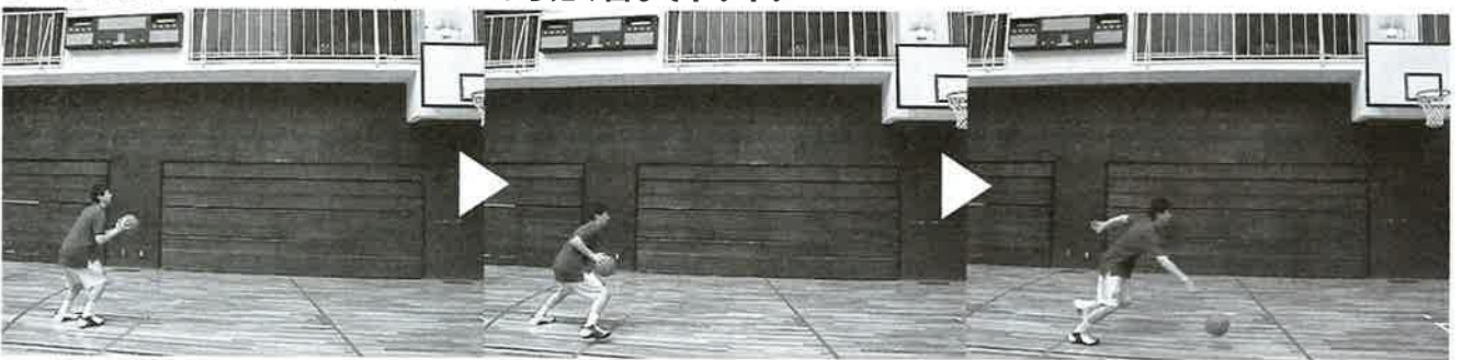
同じポジションから、そのまま足を踏み出してドリブルすればドライブになる